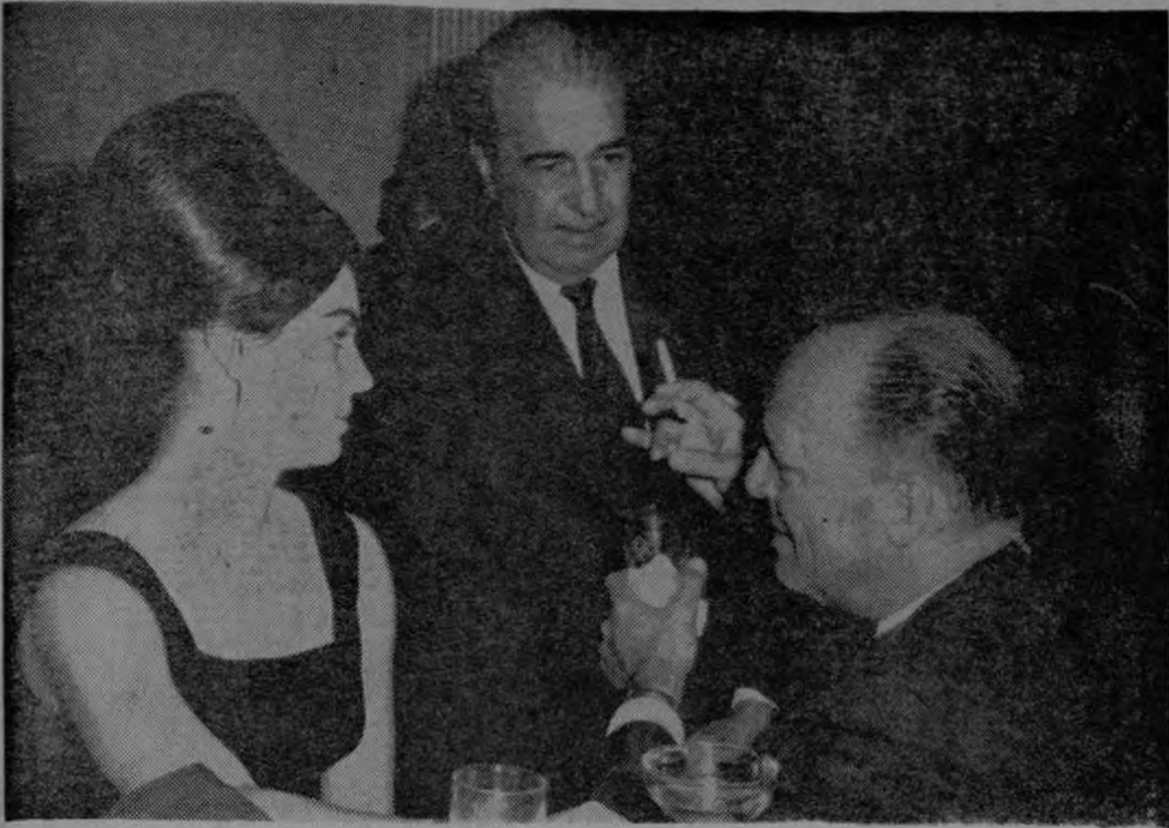
Distinguidos invitados a la recepción ofrecida por los Representantes Diplomáticos de la República Argentina, pudieron disfrutar de una reunión simpática y cordial, en el Gran Hotel Costa Rica.